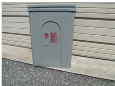
感染性医療廃棄物容器